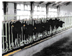
ドナー牛（左）と6頭の体細胞クローン牛