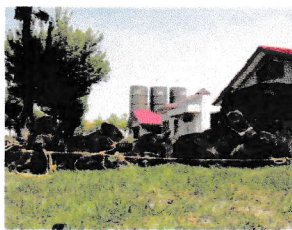
ドナー牛（右奥）と5頭の体細胞クローン牛